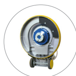
Attacco disco trascinatore e spazzole