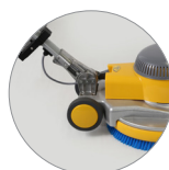
Snodo del manico