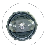
Riduttore a satelliti e planetario (L22)