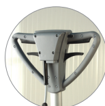
Impugnatura vista retro