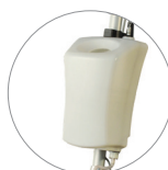
Serbatoio 12 litri