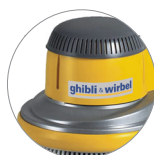
Nuova cover in plastica (L22)