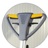
Impugnatura vista fronte