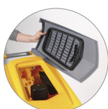
Debris tray + filtro