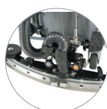
Tergitore regolabile ... ... e compatto