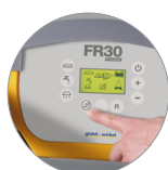
Funzione modalità silenziosa